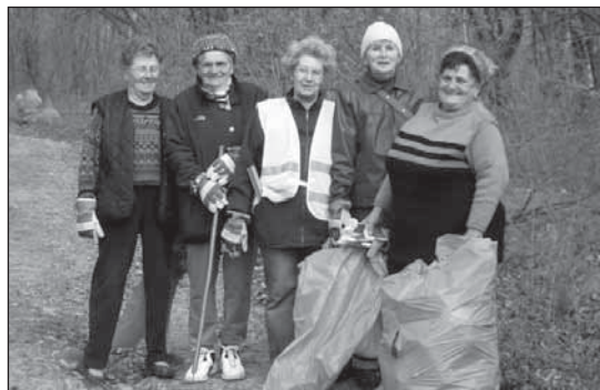
Az Őszirózsa Nyugdíjas klub vidám, szemétszedő csapata