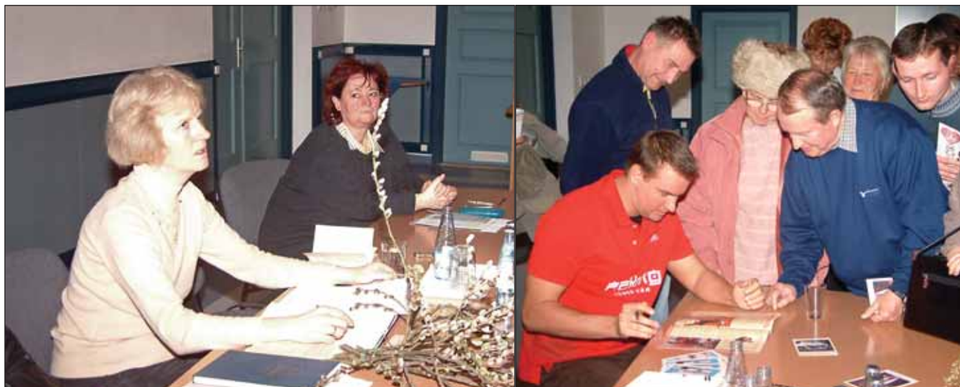
Czene Attila olimpiai bajnok úszó révfülöpi tisztelői körében