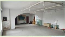
Kiürült a Honismereti Gyűjtemény